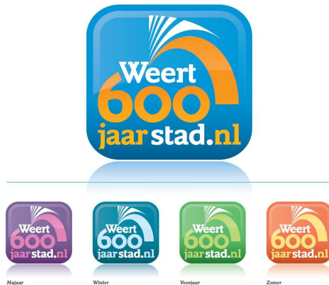
FIGUUR 3: HET BEELDMERK W600.