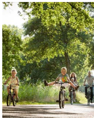
Groenste route Weert in Dagblad de Limburger