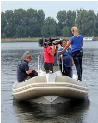
Maasplassen in uitzending VaarTV