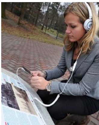
Overzicht luisterplekken Liberation Route in DDL