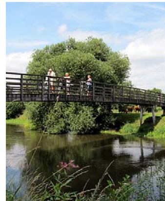
Rondje Roer in de Telegraaf