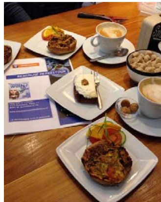
Remunjse Hepkestour in de Telegraaf.