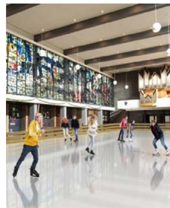
Winters Weert in Trouw