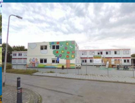
Tijdelijke huisvesting Dr. Kuypersstraat