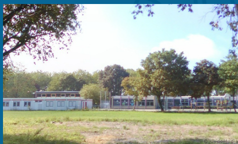
Tijdelijke huisvesting Beatrixlaan

In eerste instantie tijdelijke huisvesting gerealiseerd