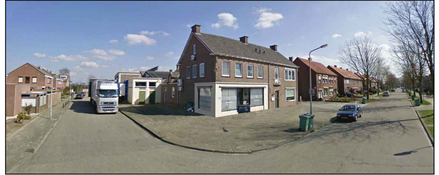
huidige situatie: hoek van de Beemdenstraat met de Middelstestraat