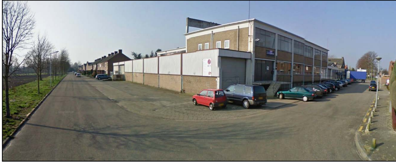
huidige situatie: hoek van de Beemdenstraat met de Achterstraat