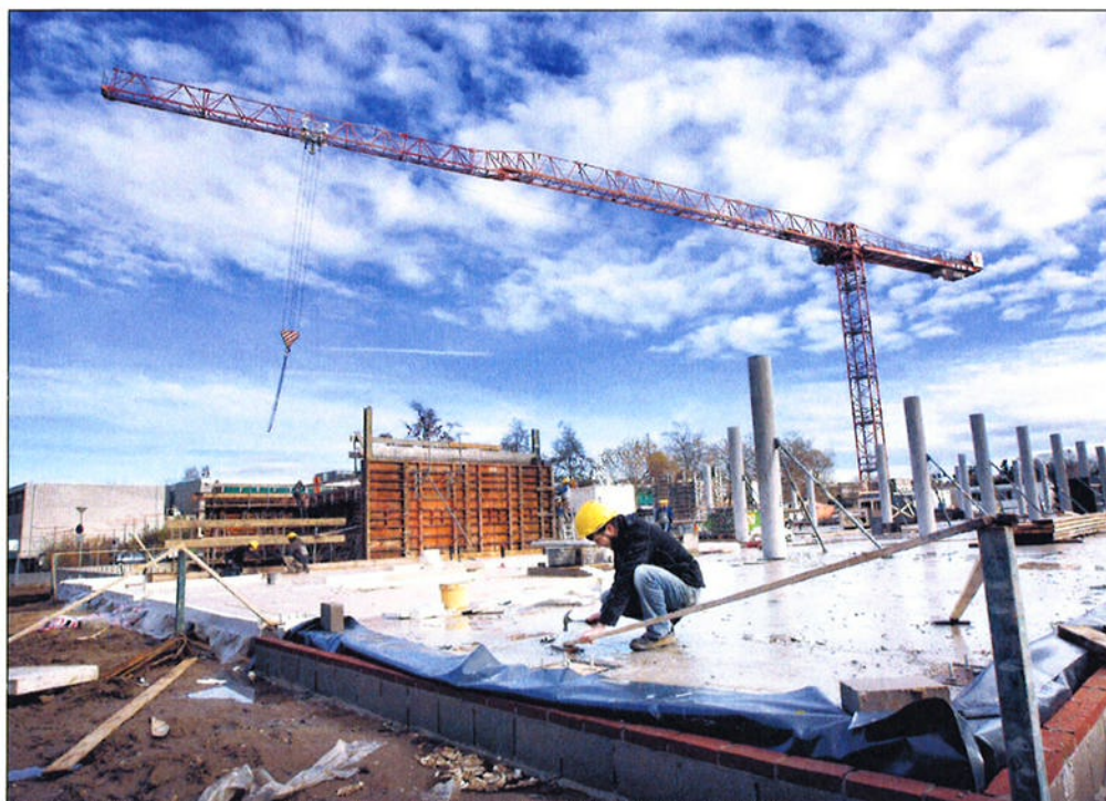
Er wordt al volop gebouwd aan het