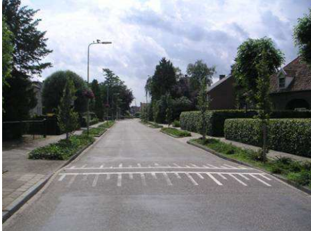
Zicht Wilhelminastraat richting St. Jansmolen