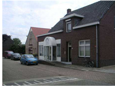
Minder gepaste luifel in historisch straatbeeld