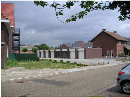
Storende garageboxen en 'gat' in gevelwand