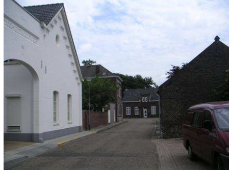
Kronstraat richting Wilhelminastraat