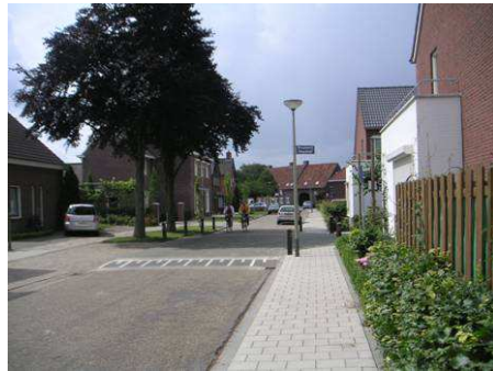
Zichtlijn door Kronstraat naar Julianastraat 31