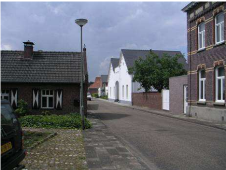
Kronstraat met poortgebouw brouwerij