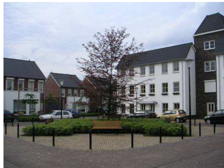
Nieuwbouw flankeert de oude mouttoren aan de Brouwerij Maeshof