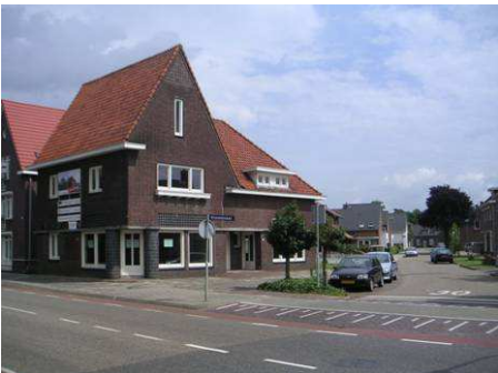
Hoek Kronstraat - Julianastraat