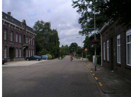
Vanaf Kronstraat richting Wilhelminastraat