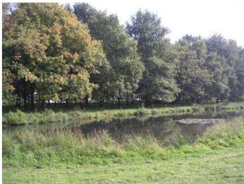
Poel nabij rotonde Ringbaan