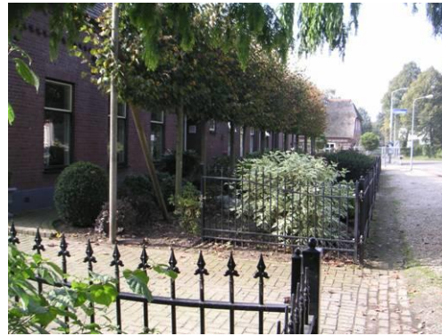
Hushoverweg t.h.v. 77 en 77b