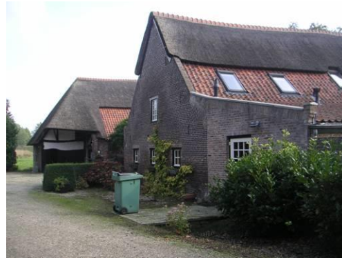
Gemeentelijk monument Maasenweg 6