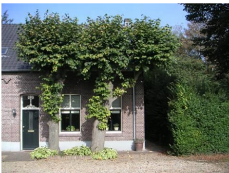
Hushoverweg 88 met leilinden