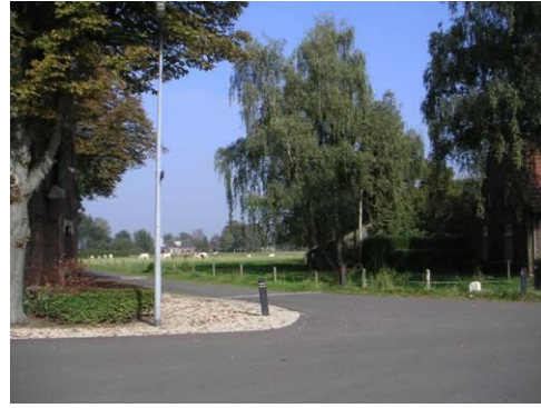
Doorzicht vanaf St. Donatuskapel naar het oosten