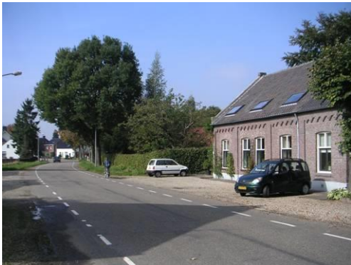
Hushoverweg t.h.v. 88 naar het noorden