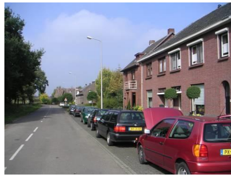
Hushoverweg ten zuiden van de Ringbaan