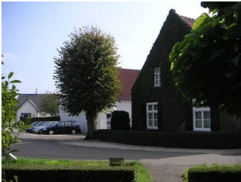
St. Donatuskapelstraat 15