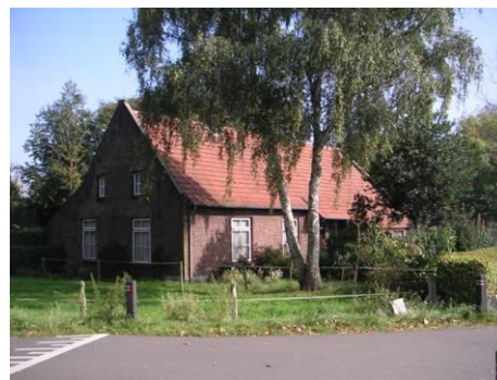
Hoek Hushoverweg 90