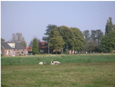
Open binnengebied aan Maasenweg met in het oog springende dakkapel op nummer 27