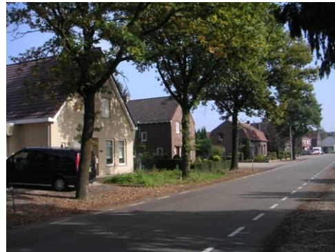
Nieuwbouw aan Hushoverweg 118c in afwijkende kleur