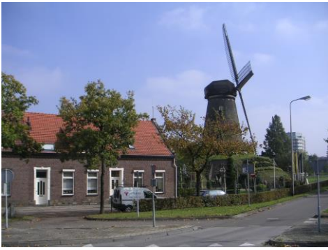
Hushoverweg t.h.v. nr 32 met molen