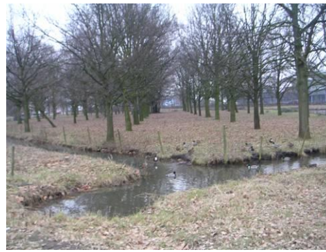
Groene karakter weide ten zuiden van Ringbaan