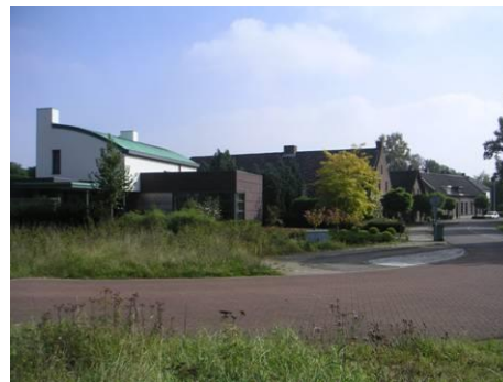
Hoek Hushoverweg – Molenakkerdreef