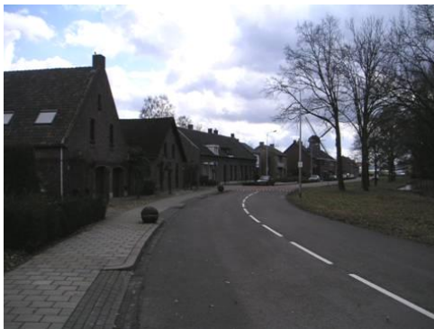
Zichtlijn op de Wilhelmus-Hubertusmolen