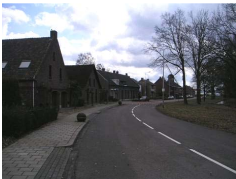
Zichtlijn op de Wilhelmus-Hubertusmolen