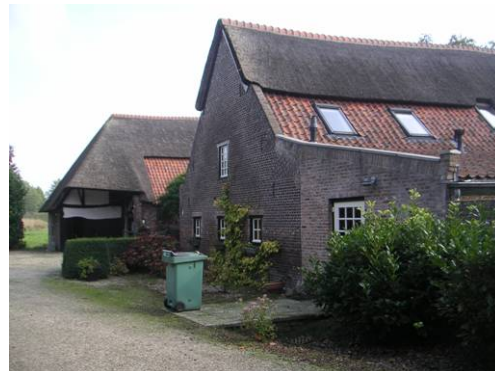
Gemeentelijk monument Maasenweg 6