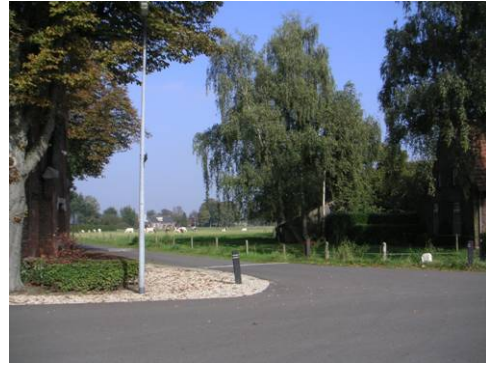
Doorzicht vanaf St. Donatuskapel naar het oosten