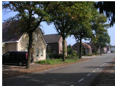
Nieuwbouw aan Hushoverweg 118c in afwijkende kleur