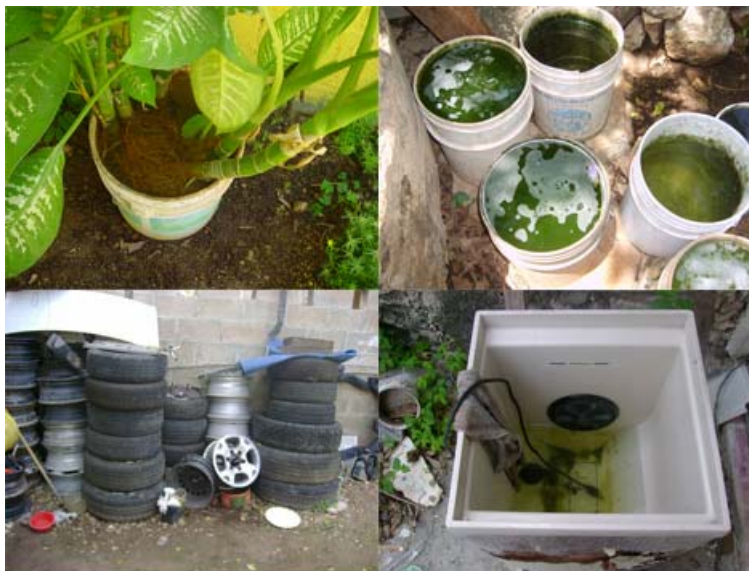
Foto: mogelijke broedplaatsen voor de tijgermug

Exotische muggen leggen eitjes in kleine, kunstmatige bakjes met stilstaand water. Denk hierbij aan gebruikte banden, vaasjes, emmertjes, bloempotten, (riool)putten en regentonnen. Grotere wateroppervlakten zoals sloten, kanalen, plassen en vijvers zijn géén geschikte broedplaatsen.